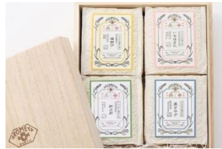
食べ比べも愉しめる2合パックの オリジナルパッケージ米