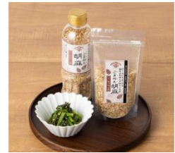
人気のごはんのお供 「ごま和え胡麻シリーズ」