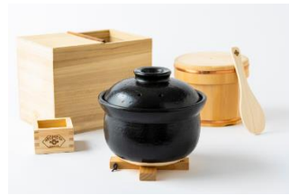
食卓を豊かにする食道具